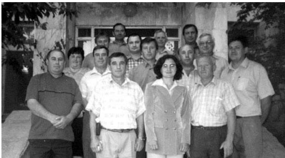
Membrii Consiliului sătesc Bardar, aleși în cadrul alegerilor locale din 25 mai, 2003