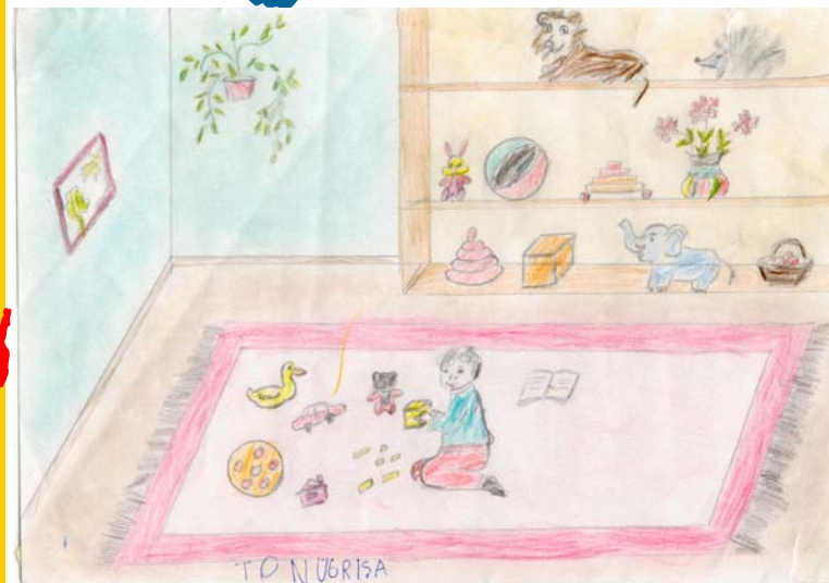
Tonu Grișa, 5 ani.