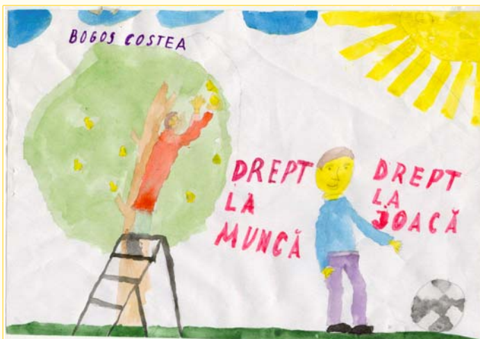
Bogos Costea, 5 ani.