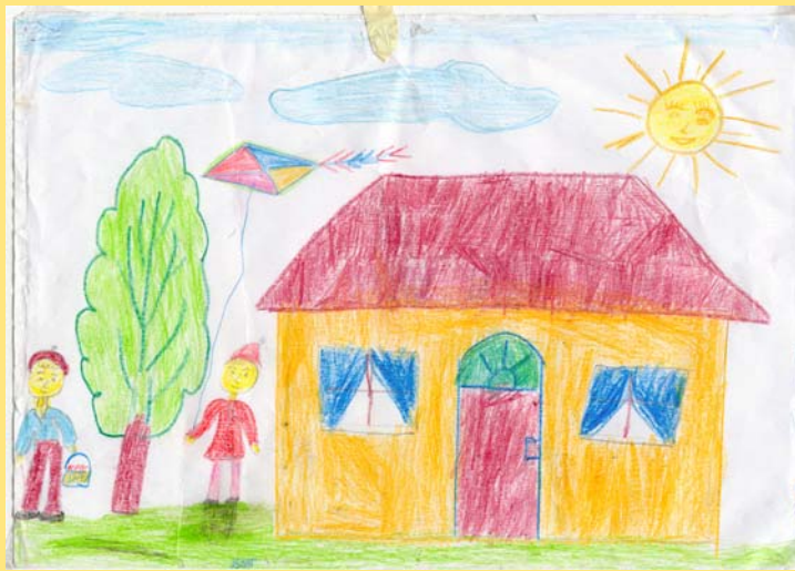
Bogos Costea, 5 ani.